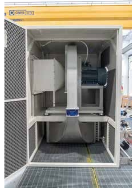
PROPELLER AND FILTER (BACK)